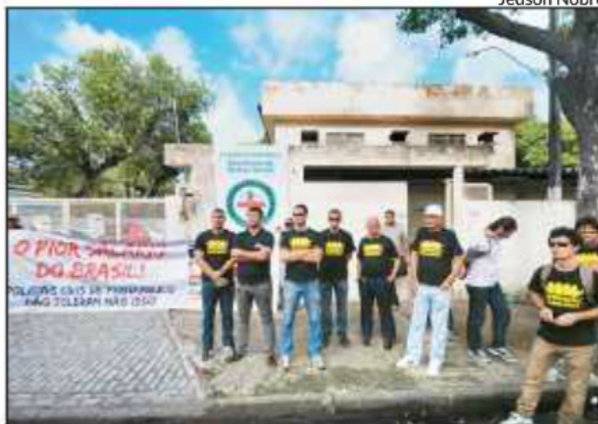
SINDICATO fez mobilização em frente ao IML de Santo Amaro