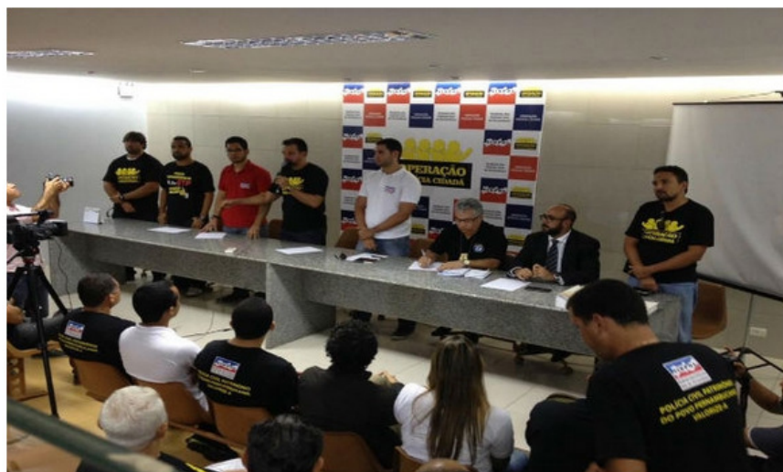
Em assembleia, o Sinpol decidiu pela paralisação nesta quarta (10) e quinta-feira (11)

A paralisação de 48 horas da Polícia Civil, que teve início na madrugada desta quarta (10), pode ser abortada por uma determinação da Justiça do Estado. Atendendo a um pedido do Governo do Estado, o desembargador José Fernandes de Lemos determinou a suspensão do movimento com o imediato retorno dos policiais civis às atividades. A orientação passa a valer tão logo o Sindicato dos Policiais Civis do Estado de Pernambuco (Sinpol) seja notificado. Em caso de descumprimento, será aplicada uma multa de R$ 30 mil por dia de atraso.