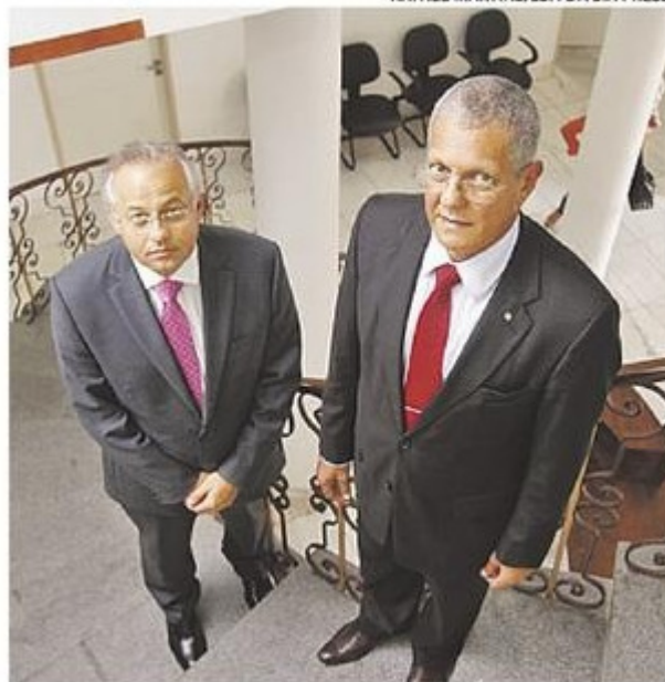
Desembargadores Fábio Eugênio e Eudes França