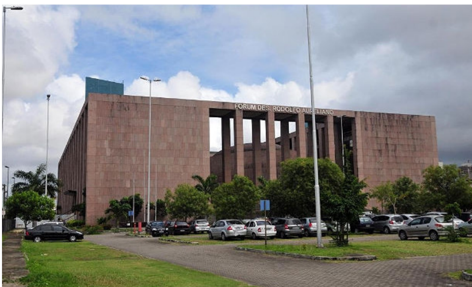
Julgamento será nesta segunda, às 9h, e deve durar apenas um dia