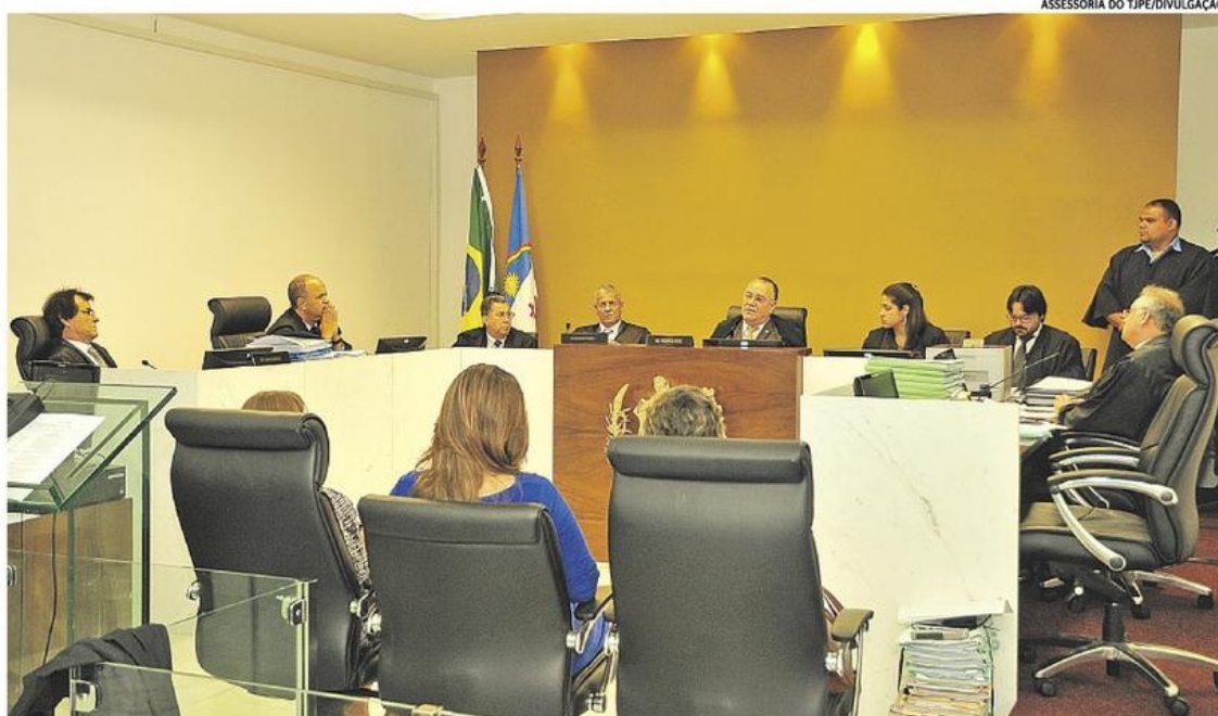
Desde a sessão solene de instalação da 1ª Câmara Regional do TJPE em Caruaru, já foram julgados mais de dois mil processos no órgão