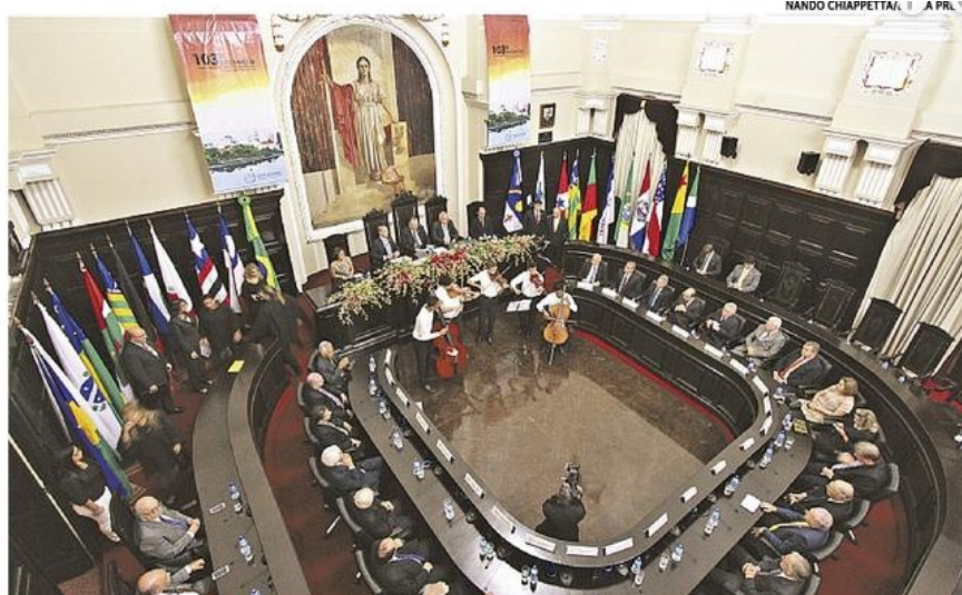
Encontro foi aberto ontem durante sessão solene no salão do Pleno do Palácio da Justiça

Presidentes dos tribunais de Justiça de todo o país estão em Pernambuco para discutir avanços no sistema