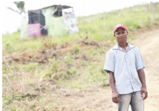
Líder diz que terras devastadas serão replantadas

Uma audiência pública no Fórum de Moreno está marcada para a primeira semana de setembro para discutir a devastação ambiental causada por algumas ocupações do MST. O encontro é resultado de uma ação instaurada pelo promotor Leonardo Caribé para apurar a derrubada e a queimada de árvores na área conhecida como "terra dos eucaliptos". As florestas foram plantadas pelo antigo cotonifício para abastecer as caldeiras da fábrica e acabaram se integrando à paisagem da cidade.