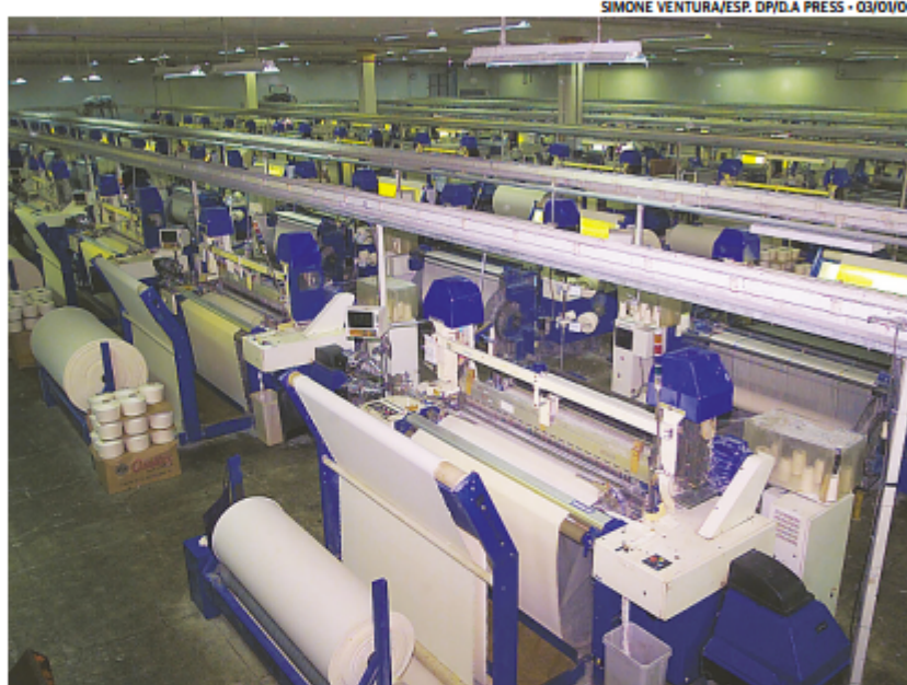
SIMONE VENTURA/ESP. DP/DA PRESS - 03/01/06

O processo de execução das dívidas da Suape Têxtil se arrasta desde março de 2011, quando foi decretada a falência da empresa. De acordo com o juiz Rafael José de Menezes, os recursos para o pagamento dos credores foram obtidos após o leilão de um terreno na PE-60, além da ven-