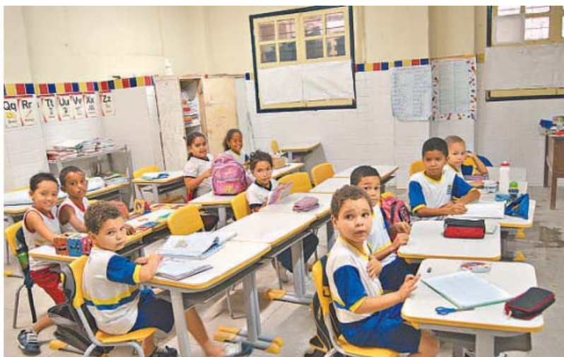
Apenas 60% dos alunos foram para a Escola Emídio Dantas Barreto ontem

Ao todo, 421 grevistas tiveram o ponto cortado. O sindicato da categoria vai pedir que o desconto não seja realizado. "A assessoria jurídica já está acionada. Caso não haja devolução do desconto, vamos pedir mandado de segurança", informou a instituição, por nota. Na reunião, a categoria também vai pedir a garantia da progressão por tempo de serviço no Plano de Cargos, Carreiras e Remuneração, o pagamento integral da aula-atividade e a liberação da multa diária de R$ 100 mil estipulada pelo Tribunal de Justiça de Pernambuco, que