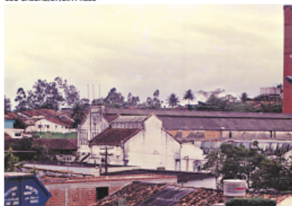
Cotonifício foi fundado em 1907 por grupo de belgas