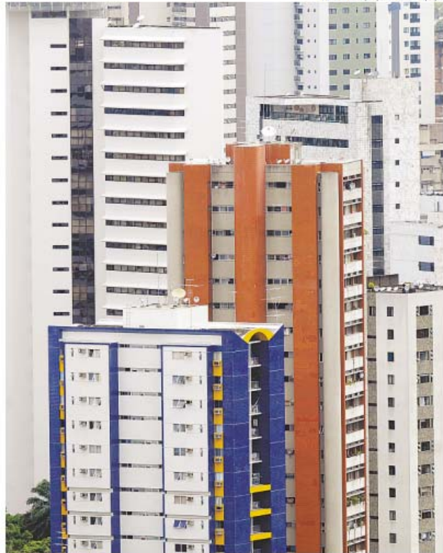
TERESA MAIA/DP/D.A PRESS - 27/01/11

Com uma linguagem simples, a edição contará com capítulos que abordarão informações como, por exemplo, registro civil, regularização fundiária, cartórios de notas, de imóveis, e de protesto