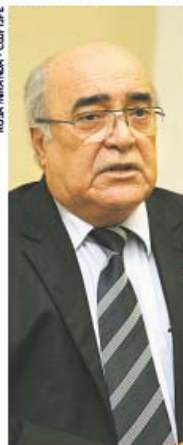
Peres defende apoio na tecnologia e eficiência dos serviços