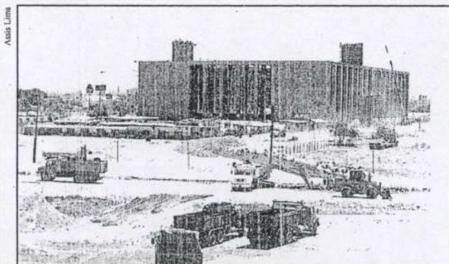
O edifício, na Ilha de Joana Bezerra, será inaugurado já em dezembro