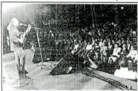
Geraldo Azevedo cantou os seus maiores sucessos para um grande público presente à festa