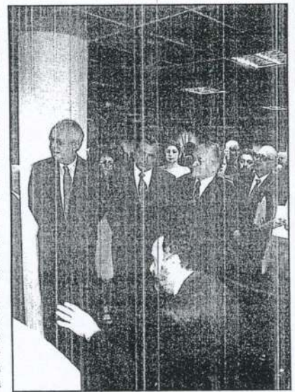
O prédio estará em pleno funcionamento em fevereiro do próximo ano