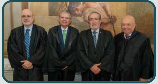
2-2-2024 Posse da Mesa Diretora 2024-26