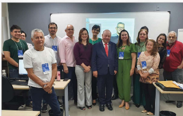
Equipe do Cartris em treinamento na Esmape

No início da gestão, o cenário era desafiador: em meio a queixas de partes e advogados, um passivo histórico de 3.362 processos aguardava envio para o STF ou o STJ. Foi lançado um plano emergencial que, aliado à reorganização e ao treinamento das equipes, gerou resultados expressivos: regularizou-se o fluxo e o número de processos críticos, ou seja, paralisados há mais de 100 dias, encontra-se em patamares mínimos , oscilando entre zero e nove.