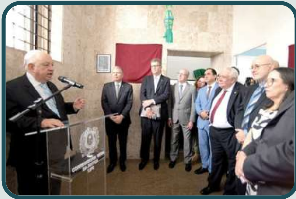
20-6-2024 Inauguração das novas instalações do Cartris