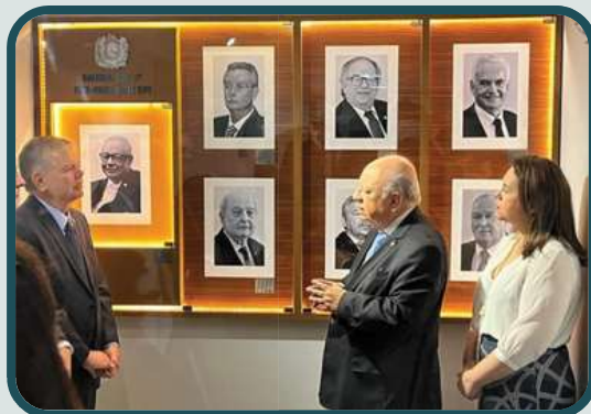
28-11-2024 Inauguração da Galeria dos Segundos Vice-Presidentes do TJPE