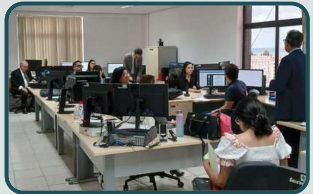
30-9-2024 Estudos sobre a jurisprudência relativa a prestações de saúde, especialmente o precedente do Tema 1.234/STJ